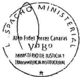
Dr. Héctor E. Arce Zaconeta MINISTRO DE JUSTICIA Y TRANSPARENCIA INSTITUCIONAL

REGÍSTRESE, COMUNÍQUESE, CÚMPLASE Y ARCHÍVESE.